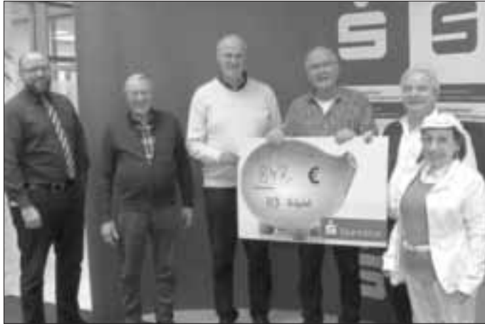
Die Aufnahme wurden von Herrn Andreas von Richthofen von ERH-TV gemacht. Foto: ERH-TV

Auch bei den mitwirkenden Künstlern, dem Gesangsduo Regenbogen, Marc Sandorf und der Promiputzfrau Gunda, die für Ihren Auftritt komplett auf Ihre Gage verzichtet haben.