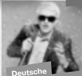
Deutsche Schlagernacht mit Heino

Feiern, tanzen & singen Sie mit Ihren Lieblingskünstlern!