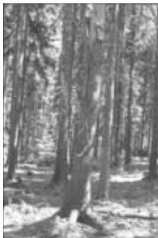
Trockenes Käferholz ist unbedeutend für den Forstschutz und kann stehen bleiben.

Erschwerend kommt hinzu, dass in einigen Landesteilen das durch Winterstürme und Schneebruch verfügbare bruttaugliche Holz im Frühjahr sehr schnell vom Käfer befallen werden konnte und die Stürme vielerorts angerissene und für den Käfer attraktive offene Waldränder hinterließen.