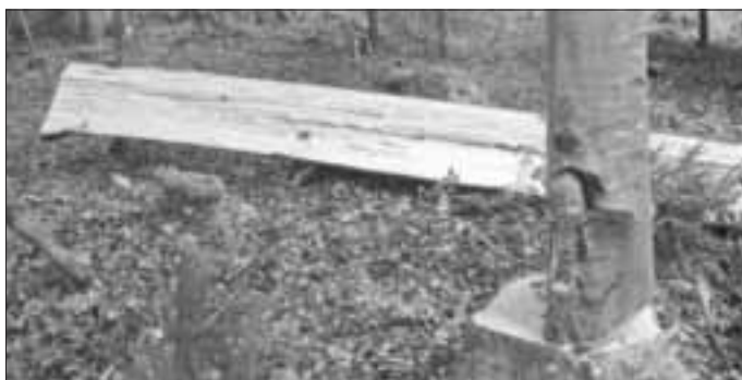
Aufgeplatzter Stammfuß: Der Motorsägenführer hat den Fällschnitt von hinten geführt, so dass der Baum wegen seiner Vorspannung aufplatzte.

Beim Fällen von „Vorhängern“ – Bäume, die in Fällrichtung geneigt sind, – verzeichnet die Sozialversicherung für Landwirtschaft, Forsten und Gartenbau (SVLFG) jedes Jahr mehrere schwere Unfälle.