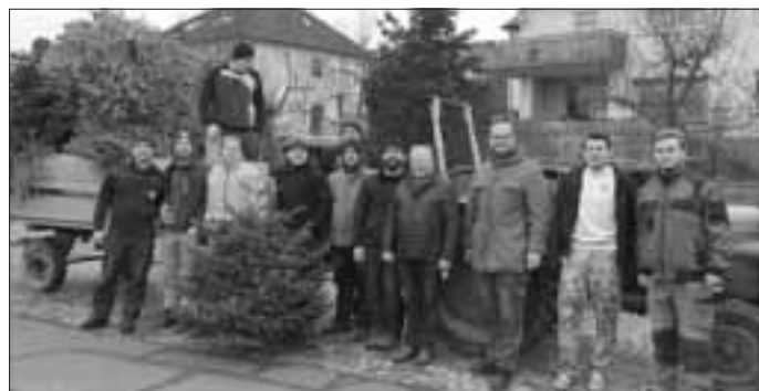
Schwaller mit Bulldogs, Bäumen und 1. Bürgermeister

Der Schwallclub Wachenroth bedankt sich ganz herzlich für die freundliche Unterstützung der Aktion „Ihr Christbaum für einen guten Zweck“. Am Samstag, 13.01.18, machten sich drei Trupps des Schwallclubs mit Bulldogs und Anhängern in der Gemeinde auf, um Ihre ausgedienten Weihnachtsbäume abzuholen. Die Resonanz auf unsere erste Baumsammelaktion für einen guten Zweck war überwältigend!