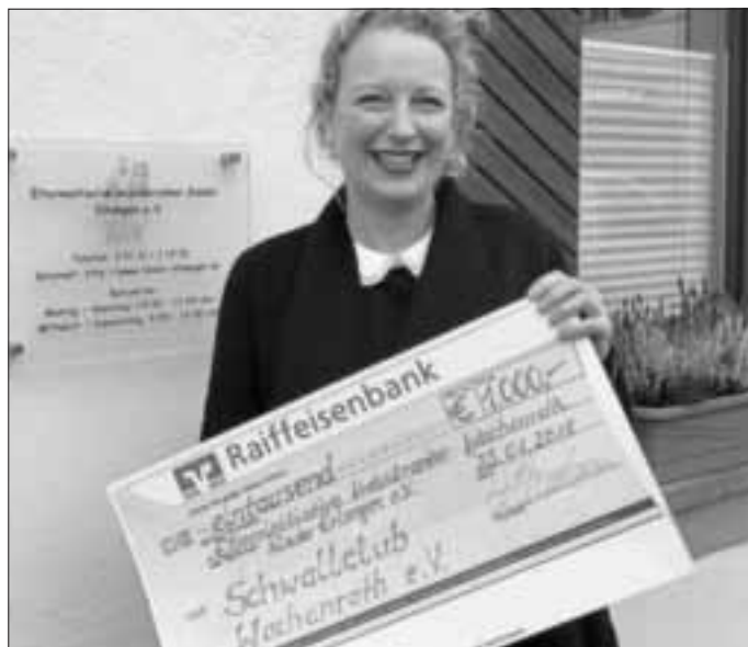
Elterinitiative Erlangen, Scheckübergabe, Fotos: Sylvia Wernsdorfer

Mit der Spende sollen Kinder und Jugendliche in der schweren Zeit ihrer Erkrankung unterstützt werden.