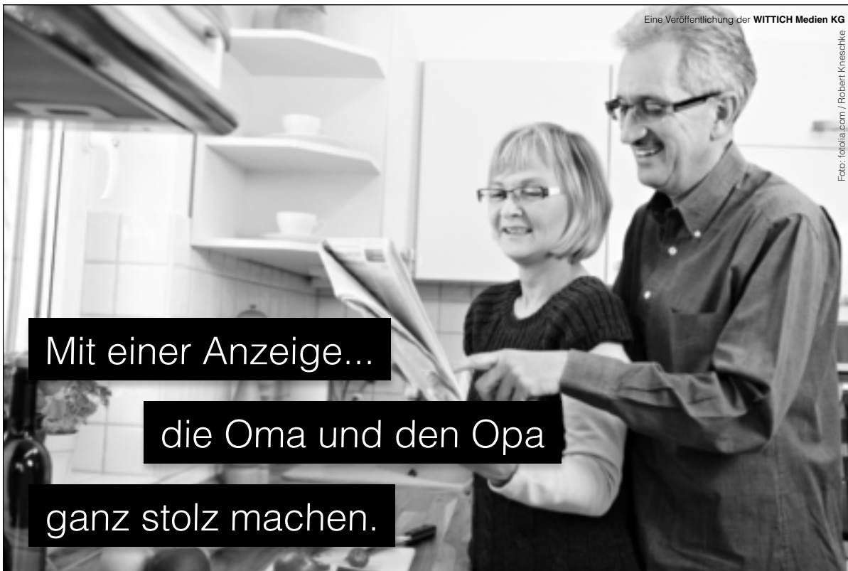
Eine Veröffentlichung der WITTICH Medien KG