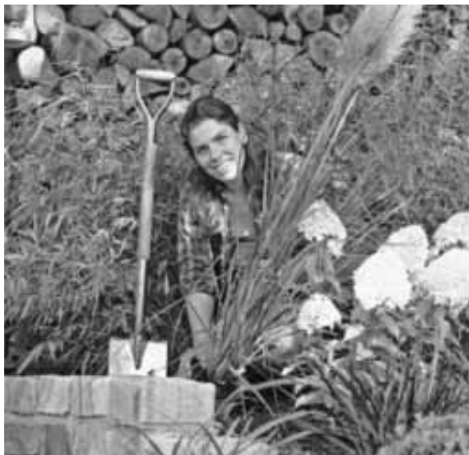
Damit die prachtvollen Halme lange Freude bereiten, sollten Gräser-Liebhaber auf die richtige Erde achten.

Die Anwendung der Spezialerde ist unkompliziert: Das Pflanzloch sollte um ein Drittel größer als der Wurzelballen ausgehoben werden. Anschließend wird der Aushub bei normalem Gartenboden im Verhältnis eins zu eins mit der Erde gemischt. Werden Gräser und Bambus im Kübel gepflanzt, muss unbedingt auf die richtige Gefäßgröße geachtet werden, damit sich die Wurzeln gut entfalten können. Idealerweise sollten zehn Zentimeter Freiraum zwischen Wurzelballen und Kübelwand und nach dem Eintopfen ein Gießrand von drei Zentimetern verbleiben.