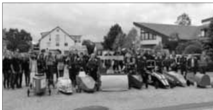
Wachenrother Flitzer nicht zu schlagen