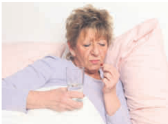
Hände weg vom starken Schlafmittel, wenn nervöse innere Unruhe die Nachtruhe raubt. Sie führen schnell in die Abhängigkeit, betäuben lediglich und bekämpfen die eigentliche Ursache der Schlafstörung nicht: die nervöse innere Unruhe