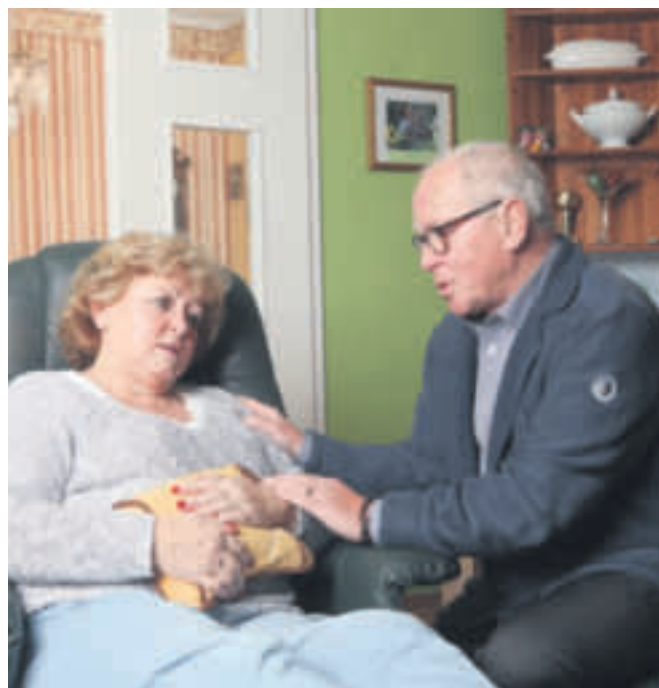
Kennen Sie das – diese Bauch- und Magenbeschwerden, Blähungen, leichte Übelkeit und das unangenehme Völlegefühl nach dem Essen

Für den Akutfall oder häufig wiederkehrende Beschwerden steht Gasteo® (20ml 7,85 Euro, Apotheke, PZN 1073 8439) heute schon in vielen Haus-Apotheken.