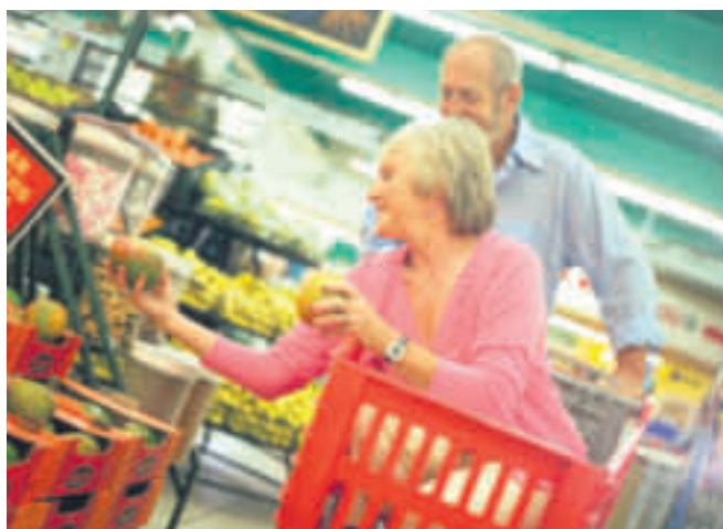
Wir haben die Bitterstoffe aus den Lebensmitteln verbannt. Mit dramatischen Folgen für die Magen-Darm-Gesundheit

Blähungen, Völlegefühl, Magenbeschwerden