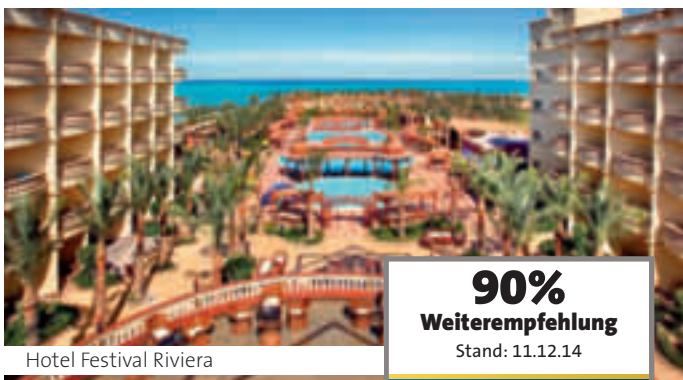
Hotel Festival Riviera