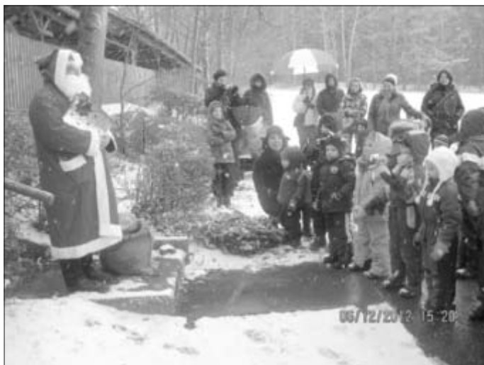
Der Nikolaus auf dem Horbacher Keller