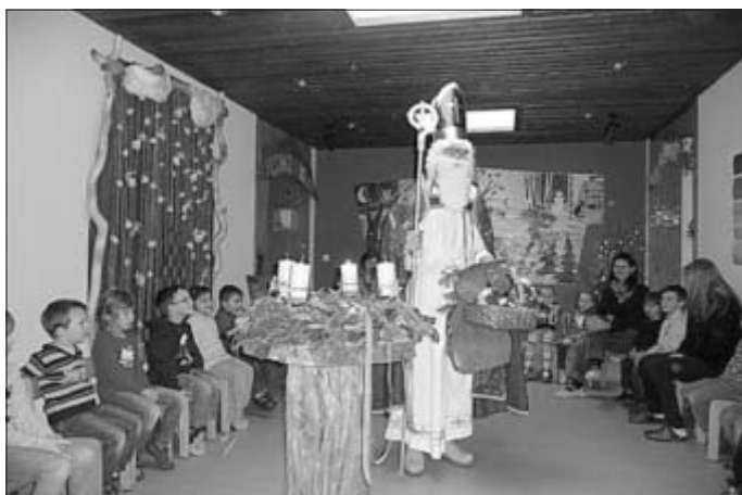
Der Nikolaus in der KiTa Villa Kunterbunt